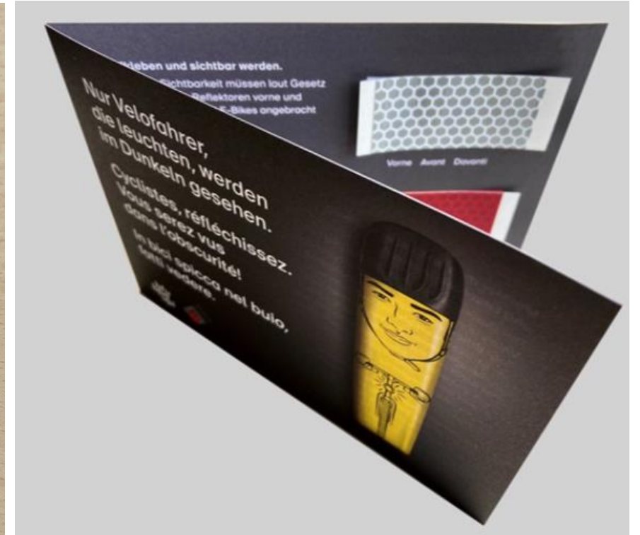
Reflektoren in 100er-Packung und im Flyer